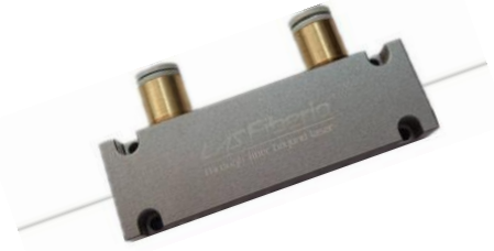
P28: 65x20x15mm 剥离功率100~200W