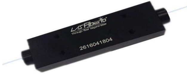
P252: 115x30x15mm 剥离功率<100W