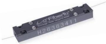
P23: 65x12x7.5mm 剥离功率<50W