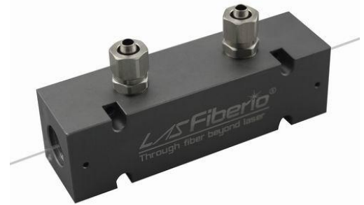
P283: 75x21x20mm 剥离功率 200~500W

在光纤激光器中，泵浦与信号在掺杂光纤中经过能量交换，泵浦减弱，信号增强，泵浦能量无法全部被吸收，总会有所残留，并在双包层光纤的外包层中传输（如793nm, 808nm, 915nm, 940nm, 976nm等），这部分能量往往是不需要的，而且可能对后续器件造成伤害，用CPS可以有效“剥除”包层内的残余泵浦甚至是返回的反射信号，但却不影响纤芯信号。